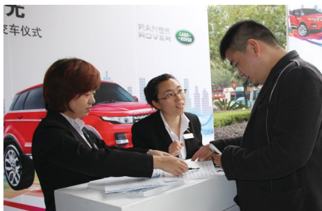
东南地区运通和乔 王蓉

杭州运通捷豹路虎中心此次“穿越极光”上市品鉴会完美演绎了路虎品牌从1948年首辆路虎问世到路虎揽胜极光的炫目出击，这是一次完美的蜕变以及重生！相信运通捷豹路虎中心也能借助极光上市惊艳杭城！